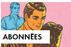
HPI, surdoué, HPE, hypersensible : quelles sont leurs caractéristiques et comment les différencier ?