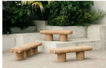
Design parade 2023: les étoiles montantes à suivre qui s'exposeront cet été