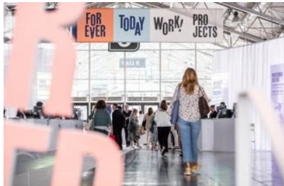
Salon Maison&Objet : tout ce qu'il faut savoir pour y aller