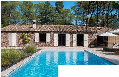
Le poolside comment r Comm